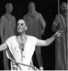
රටීපත් නාට්‍යයේ මුහුණ පෑවකුලකර මරිචිකාවත්

ඉතිහාසයේ එකම සිදුවීම හෝ සිදුවීම් පෙල නාට්‍ය කරුවන් රැසක් විවිධ අවස්ථාවල දෙමුණේ ඉදිරිපත් කළ අවස්ථා වීරළ නොවේ.