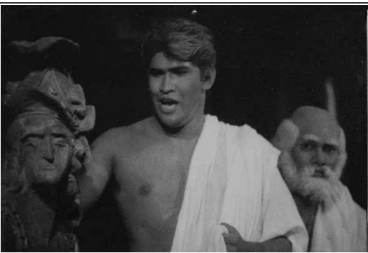
කොෆොක්ලිස් ගේ රචිත භාට්‍යයේ සිංහල නිෂ්පාදනය අතුලු ඊරිස් අධ්‍යක්ෂණය කළ ෧෧෧ භාට්‍යයේ ග්‍රීක මිදුම්වල රචනා දරුවන්ගේ ෧෧෧ රචනාවේ වෙනුවෙන් භාග්‍ය භාට්‍ය උද්දාය රචනා කළ බහුමාන සම්මානයක් හිමි විය.

මේ අතර පර්සියන්වරු භාට්‍යය ඇද්විතිය ස්ථානයකට පත්වෙයි. ඒ මන්දයත් ඓතිහාසික සිද්ධියක් මුල් කොටගෙන භාට්‍යය රචනා කර තිබීමයි. පර්සියානු පුද්ගලයන්ට වස්තු ඕප්ප වී තිබේ. පුරාණකෘතිය වලට අමතරව ඓතිහාසික සිද්ධි වස්තු ඕප්ප වූ භාට්‍ය තකවත් විශාල සංඛ්‍යාවක් ග්‍රීක භාට්‍ය කරුවන් අතින් බිහි වූ බව අප අමතක නොකළ යුතු කරුණකි.