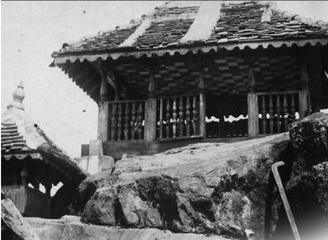
කල එය දහස් වරක් වටයේ.