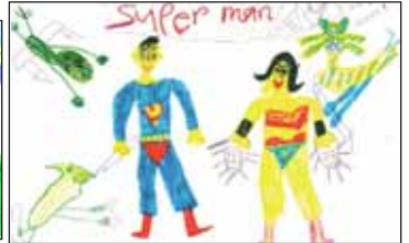
සුනෙල්කා හාලිපත්දෙණිය 1 වසර