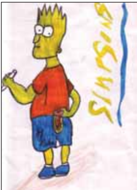
මමිල් මහජනරත්න විජය ආච්චි 9