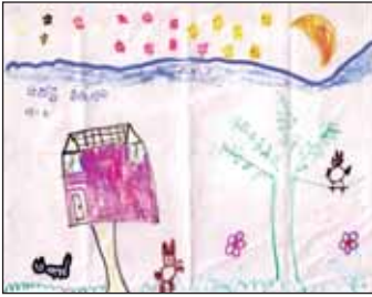
Lakme Meemeduma 6Yrs