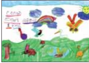
ලැක්සනා - සැනුම් මැලිමිඩඩා 1 වසර