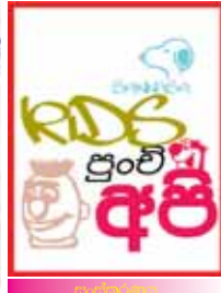
පාසිඳුගම පුට්ටි අපි