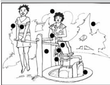
පසුගිය මාසයේ විසඳුම