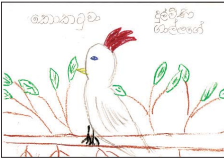
දුල්ලිකා ගැල්ලේ - කොකුටුවා