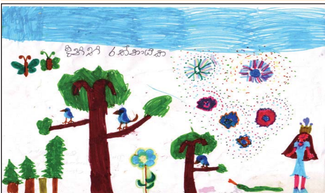
දිනිති රත්නායක - ක්ලේරිකර්ස්