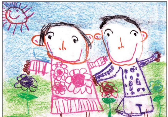
Dinithi Hiranya Mallikarachchi - 4 yrs - Dandenong North