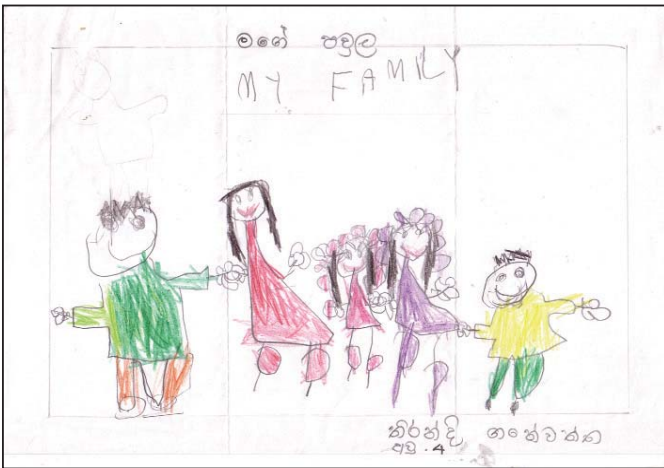
මගේ පවුල - තිරන්දි ගණේවත්ත - අවු 4