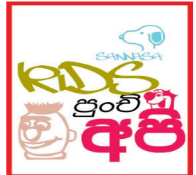
ආවිලා ධර්මානුකී - 1 වසර