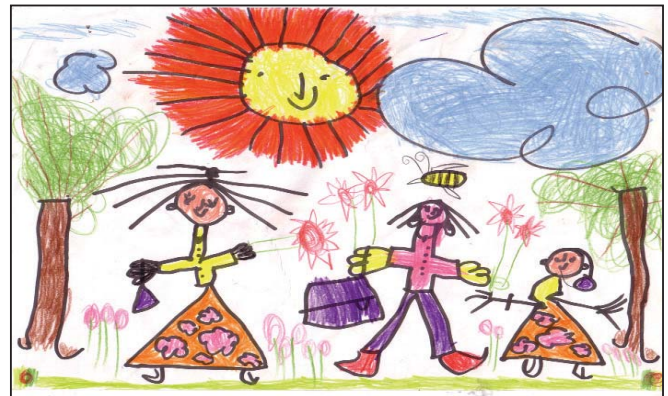
මගේ ලොකු අම්මා තුනානි අක්කි ආච්චි අම්මා - නවීන් දසනායක - අවු 4