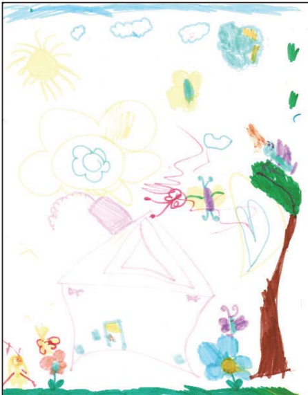
Teesha 6 years old