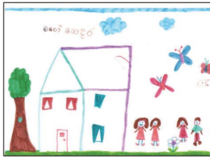
Tiara - 7yrs