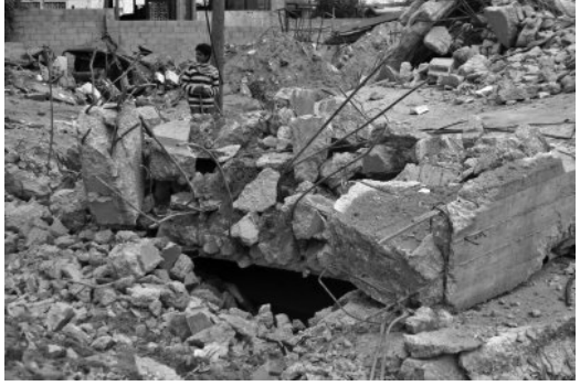
විනාශ වූ පලස්තීන ගොඩනැගිල්ලක්

ය. අද සිටින යුදෙව් ජාතිකයින් බොහෝ දෙනෙක් උත්පත්තියෙන් යුදෙව් ජාතිකයින් නොවූ බවත්, යුදෙව් ආගම පසු කාලයකදී වැළඳ ගැනීම මඟින් යුදෙව් ජාතිකයින් බවට පත් වූ අය බවත් පවසමින් පලස්තීන විභාග ඉහත පැවසූ යුදෙව් වාදීන්ගේ මතයට විරෝධය පාති. මෙම විරෝධය යටපත් කර දැමීම සඳහා යුදෙව් ජාතිකයෝ තමන්ගේ ජාන පරිහාන කිරීමට පවා පෙළඹී සිටියි.