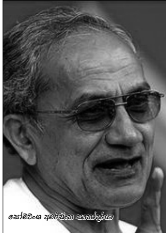
නෞවතෝදය අවර්ධනා සහෝදරයා

ඒත් දැන් ආණ්ඩුව මෙම යුද්ධය ආවරණයක් කරගනිමින් රට පාහැර දෙමින් ඉන්නවා. එය හංගන්න බැහැ. ඒක තමයි ඇත්ත. අද රාජපක්‍ෂ පාලනය ඉන්දියාව ඉදිරියේ දණ ගහලා, නිවට වෙලා ඉන්දියානු උවමනාව අනුව අපේ ආර්ථික හා දේශපාලන කටයුතු හසුරුවන්නවා. මේ කරුණු අඩි කලිනුත් පැහැදිලි කළා. ඒත්, මෙහිදීත් සහනින් කළ යුතු වෙනවා. සන්නද්ධ හමුදා සටන් කොට මුදාගත් නැගෙනහිර පළාතේ ත්‍රිකුණාමලය දිස්ත්‍රික්කයේ වර්ග කිලෝමීටර් 675ක භූමියක් ආර්ථික කලාපයක් ලෙස ඉන්දියාවට දෙනවිට ඒක පාහැරීමක් නොවෙයිද? අපේ මව්බිම, අපේ මහපොළොව මෙතරම් ප්‍රමාණයක් ඉන්දියාවට දෙන්නේ ඇයි? ඒ භූමියේ ජනයා අනාථ කඳවුරුවල දුක් විඳින අතර ඒ ජනයාට අයත් භූමිය ඉන්දියාවට ලබාදීලා තියෙනවා. අපේ රටේ මුහුදුබඩ තිබෙන වටිනා බැණිස් සම්පත් ඉන්දියාවට දෙනවා. මන්නාරම දෝණියේ දෙන ලොවගැනීම ඉන්දියාවට පවරනවා. කන්කසන්තුරේ සීමෙන්ති කම්හල ඉන්දියාවේ බිරිලා සහායට දෙනවා. මේ කරුණු අඩි කලිනුත් පැහැදිලි කළා. මුහුදුබඩ දුම්බර මාර්ගය ඉදිකිරීමත් ඉන්දියාවට දෙනවා. ඒ සියල්ලට වඩා බරපතල ලංකාවේ බලයක් (විදිලිය හා තෙල්) හැසිරවීමේ බලය ඉන්දියාවට දෙමින් සිටියි. එය ජාතික ආරක්‍ෂාවටත් තර්ජනයක්. ඉතිං මෙය පාහැරීමක්