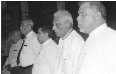
ගිතාපත ගුණවර්ධන මහතා එක් වරක් මහතා අමාත්‍ය බිමේ සිරිතල ද සිවුම් මහතා

"රදළු යුගයේ හේධාර්ග්‍යයක් වූ මේ කුමය සම්ප්‍රදානයේ අනෙකි කාර දැමිය යුතුය. රටේ මහත්තයාටත්, මුදලිටත්, විද්‍යා ආරච්චිට හා කෝරාලටත් මේ රටේ ජනතාව වාල් කරගෙන පුරාකන්නට තවදුරටත් ඉඩ