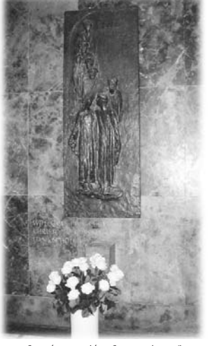
සොෆී හෝල් සහ යුද චරිත පත්‍රිකා ව්‍යාපාරය සැකිලිම මියුනිච් සර්වමය තුළ විහිදුවා ඇති බිහිවීම වලකා