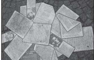
සර්වමය තුළ යුද චරිත පත්‍රිකා බෙදා හැරීමේදී ඉහළ මාලයේ සිට එවූ විසින් ගිය පුස්තක හුවා දැක්වීම සඳහා මිසුනිනි සර්වමය විවෘත ඉදිරිපස පොළොවෙහි නගා ඇති බිහිවීම

සොෆී මර්දලේනා හෝල්, 1921 මැයි මස 09 දා ජර්මනියෙහි, ෆෝර්න්බර්ග් (Forchtenberg) හි උපත ලද අතර, සහෝදර සහෝදරියන් තිදෙනෙකුගෙන් යුත් පවුලක තම දෙමව්පියන් සමඟ 1930 වනතුරු එහි ජීවත් වුවාය. අනතුරුව ලුඩ්විග්ස්බර්ග් (Ludwigsburg) නගරයේත්, එසර් දෙකට අනතුරුව උල්ම් (Ulm) නම් නගරයේත් පැවැත්වී සිටියාය.