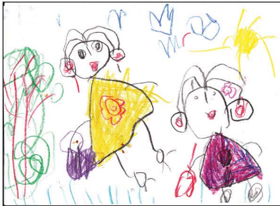
අම්මයි මමයි - Dulanya Dassanayake 4 yrs Greensborough