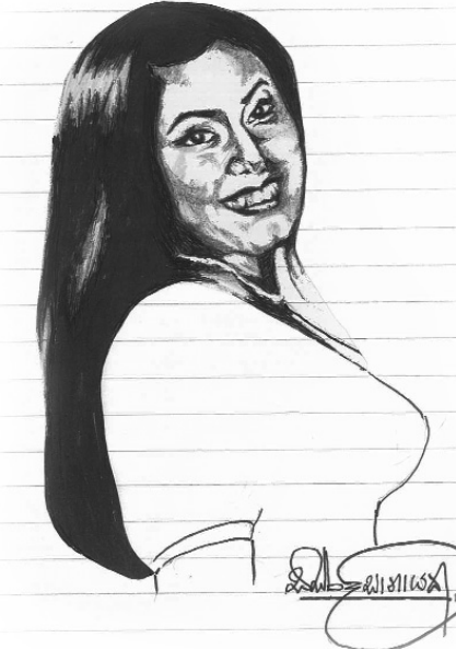
"පස්සෙ දවසක කසුන් දුරකථනයෙන් කතාකරලා ඇතුළුවා" මම මේ ගීතය කිව්වට

"අතරක් ම මෙතකදී මම අළුතින් සී. ඩී. තැටියක් එළි දැක්වූයේ නෑ. ඒත් අන්තිමට එළිදැක්වූ ටිපු ගීත එකතුවේ අතැගුල්