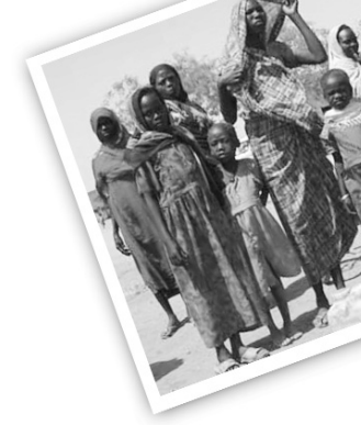
විචාරණයක් පැවැත්වූයේ වසර පහකට පමණ පසුවය.

වර්ග කිලෝමීටර 2 376 001 කින් යුත් සුඩානය රාජ්‍ය උතුරු අප්‍රිකාවේ විශාලතම රාජ්‍යයි. බටහිරින් මධ්‍යම අප්‍රිකානු ජනරජයද උතුරින් ඊජිප්තුව සහ ලිබියාවද නැගෙනහිරින් ඉතියෝ-පීටියාව සහ ඊරාක්ද දකුණින් කෙන්යාව උගන්ඩාව සහ කොන්ගෝදී පිහිටා තිබේ. ලෝකයේ දුප්පත්ම රටවල් දහය අතරින් එකක් වන සුඩානය හමුදා පාලනයක් සහිත රටකි. 1989 සිට එහි පාලකයා ලුතින් ජෙනරාල් හුසේන් ආමඩ් අල් බසීර් ය. දශක දෙකක් තිස්සේ පැවති සිවිල් යුද්ධයකින් පසු මෙවර සුඩානයේ ජනමත