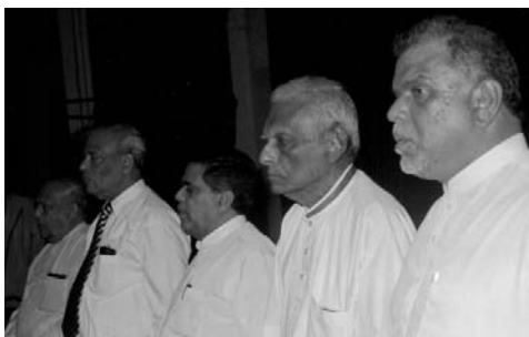
නව්‍යාගාලේදී පැවති විදුලි ගුණවර්ධන තුනුස්වර්ණ උළෙලේ දී සියලුන් ආගමන මහතා. අනුරාධපුර ආගමන මහතා, පුරාණ විද්‍යාලයේ ආගමන මහතා, ආර්ය ආගමන මහතා.

වයසේන අත්කල්, අපේ රටේ ප්‍රථම විධායක ජනාධිපති වේ. ආර්. ජයවර්ධන මැතිතුමාගේ මාධ්‍ය දේශමි ලෙස එකල කලක් කටයුතු කලා. එනමුත් ඔහු විදේශ ප්‍රතිපත්තිය පිළිබද කළකිරීමෙන් සිටි කෙනෙක්. එම අතීතය සිතිපත් කළොත්.