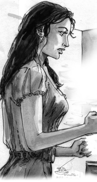
ලැබ දෙනු ඇතැයි නිමන්ත සිතුවේ ය.

විදෙස් ගත වූ අප්පත්ත රැකියාවක් ලැබ, විවාහ වී පැරසියේ පිටත් වෙයි. නිවාඩුවක් ගත කිරීම සඳහා පැරසියට එන්නැයි අප්පත්ත වරින් වර කරන ආරාධනය නිමන්තට සිහිපත් විය. මේ තාක් කාලයක් විවිධ හේතු දක්වමින් ප්‍රතික්ෂේප කළ ඒ ආරාධනාව සඳහා බලන්නට මෙය සුදුසුම අවස්ථාව නොවේ ද? වෙනසක් සඳහා විදෙස් ගත වීම අම්මන්දගේ පවා සිතට සහනයක්