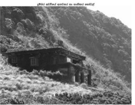
දුම්බර අඩවියේ ආවරණ සුරක්ෂණ කොටස

හෝටලය විදේශීය පර්යේෂකයන් සඳහා ලබා දීමට නියමිත බව සඳහන් වේ. ඉතා සුවිශේෂී වනාන්තරයක් ඇසුරේ මේ ආකාරයෙන් විදේශිකයකු පවත්වාගෙන යන හෝටලයකින් සිදු වන හානියක් කුමක් ද? මෙමගින් කවර ආකාරයේ ජාන සම්පත් අප රටින් පිටට මතු ඇද්ද යන්න පිලිබඳ ව බලධාරීන් සිතා බැලිය යුතු ය.