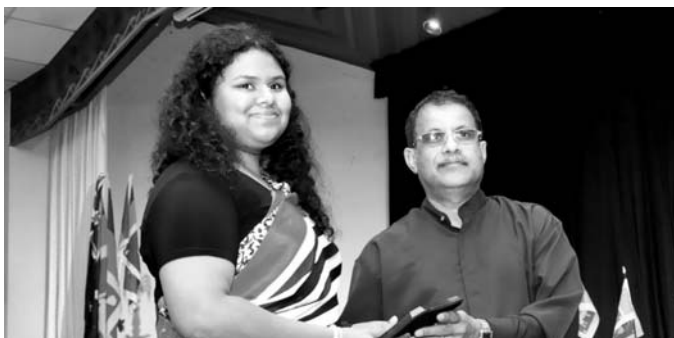
Braver Collage හි 11 වසරේ ඉගෙනුම ලබන ඇයගේ අනාගත බලාපොරොත්තුව නීති උපාධිය හැදෑරීම. මෙල්බර්න්වල උසස් විශ්ව විද්‍යාලයක නීති උපාධිය හදාරන්න නම් VCE විභාගයෙන් ඕස්ට්‍රේලියානු තෘතීයික පාඨමාලා සඳහා ඇතුළත් වීමේ අගය ATAR 98.0ක් ලබාගත යුතු බව ඇය දැන සිටියා. මේ අතර වාරයේ ඇයට