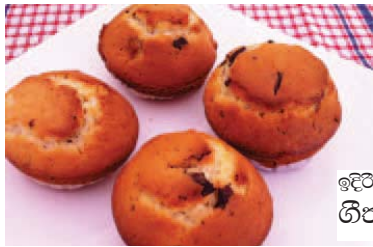
ඉඳිපත් කරන්නේ ගීතා යටවර