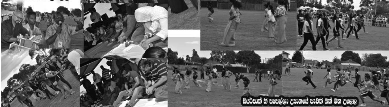
බියර්සාන් හි සකෙල්ලා දුකානේ පැවති බක් මහ දළඹ