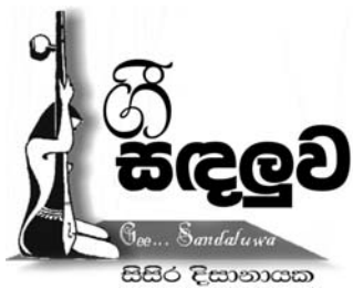
සුපුරුදු සිතහට ආයෙමන!

සියවරුන් තම දියණියන්ට ගායනා කරන ලෙසින් ලියැවුණ ගීත කීපයක්ම අපේ සිතලම ගීත අතර තියෙනවා. පියෙකු හා දුවක ඇති බැඳීම වෙනම-මම අකාරයක බැඳීමක්. ඒ බැඳීම වත් පොහොසත් කම්, කුල ගීත, කුලිකකම්, තරුණිඵල, උගත් නූතනකම් වාගේ දේවල්ලිනි තොරව කාටත් එක වගේ දැනෙන බැඳීමක්. ඒ නිසා මේ මිනිමක සිටින මිනෑම පියෙකුට දැනෙන පොදු හැඟීම් පෙළක් කැටි වුණා ගීතයක මත ගොත වීමකටත් මෙවර " ගී සැදුම්" සූදානම් කළා.