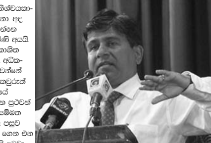
පාර්ලිමේන්තු මන්ත්‍රී නීතිඥ විජේදාස රාජපක්ෂ මතකා සභාව අමතමින්

අධිකරණ පද්ධතිය දින බලද්දී විනිශ්චයකාරී වරයෙකු පත් කල සම්ප්‍රදායක් තිබුණා. අද බොහෝමයක් විනිශ්චයකාරීවරු ඉන්නේ ගිවිසුම දෙපාර්තමේන්තුවෙන් පැමිණි අයයි. විනිශ්චයකරුවෙකු පත්කරද්දී අප්‍රකාශිත මුලික පදනමක් තිබිය යුතුයි. ඉහල අධිකරණයේ විනිශ්චයකාරීවරයෙකු පත්වන්නේ කුමන පදනමකින්ද යන්න අද අපි කවුරුන් දන්නේ නෑ. නමුත් ඉහල අධිකරණයේ විනිශ්චයකාරීවරයෙකු ඉවත් කරන්න පුටුවත් දෝෂානියෝගයක් ගෙනලලා. එය සම්මත කරල ජනාධිපතිවරයා අත්සන් කල පසුව ශ්‍රී ලාංකීය චරිතයක් ගෙනවිත් ගෙන එන දේ දෝෂානියෝගය අවස්ථාවේ අපි දුටුවා ලංකාවේ අපරාධකරුවෙකුටත් තිබෙන පහසුකම් ඇයට ලැබුණේ නෑ. මුළු ක්‍රියා-පටිපාටියම ගිවිසුමේදී. ශේෂ්ඨාධිකරණය හා