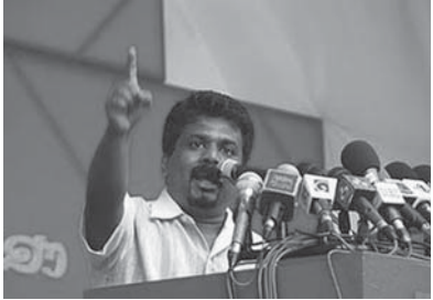
ජනතා විමුක්ති පෙරමුණ භාරත ගල් අනුලයේ සැලකිලිමත් වනාවක් ජනමතයට පසින් ගසන්නටද?

අමාත්‍ය දිනේෂ් ගුණවර්ධන මහතා ප්‍රබල ප්‍රකාශයක් කර තිබිණ. ඒ අනුව විධායක ජනාධිපති කුමය අවසන් කළ යුතුය.