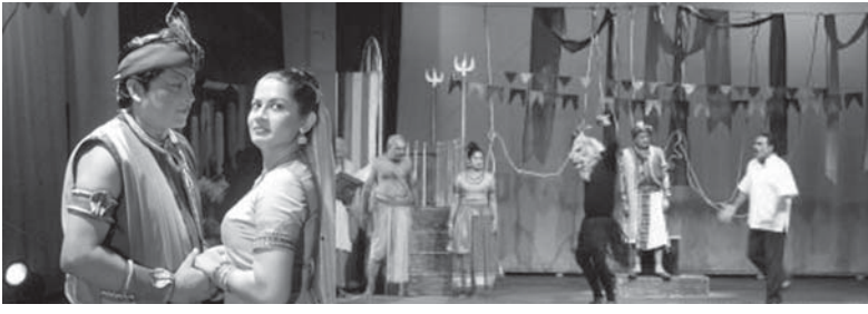
බස බිඳෙන සුඵල. වෂ්ඨියෙකුගේ එසේත් නැතිවම නුතන දේශපාලන බිඳවැටෙනකුගේ නැවත අතිශය පෂ්ඨිකයාට තැනක් නැත. මිලප ආදාසය හඳුනා විසිකරනවා පමණක් නොව ඉතිහාසයේ පෂ්ඨිකයා වෙරී මනින් ආවේදනගේත් බවට ද පත්වෙයි. පුළුල් ඇරුගම තරුණ නවවෙයි වර්තය තුළ අලුත් නවවකු නොව දැකපුරුදු පුපුරුදු නැවෙකු ම හැකි. ඒ මතු කලින් දැක පුරුදු නිසාවෙන් නොවේ. මතු තුළ වන සුවිශේෂී රටක කුසලතාවය නිසා-වෙයි.

බැවින් නාට්‍යයේ හරයට එය බාධාවක් නොවේ. ජනකගේ අවකාශයක් සමග නාට්‍යයේ ඉදිරියට එන්නේ නිර්මාණකරුවායි. පුපුරාගොනා, පෂ්ඨිකයා හෝ වේදිකාසී වෙත මුහුණින් කළු ලෙසින් දැනුම්දෙන නැමට්ටිකම ජනක ලෙසට කතාක-රන්නේ තම තමන්ගේම හෘද සාක්ෂියයි. මෙතෙක් මා දැක තිබූ නැම නිර්මාණකරු පාහේ වූයේ කතාවට, වර්තයට උචිත ලෙස කලාකරුවා මනාව භාෂාව හසුරුවන නැමයි. එසේ නොව කලාකරුවාට ද නිර්මාණයට ද ඉදිරියෙන් සමත් භාෂාව විසින් නිර්මාණය වෙනෙයවන අපූර්වත්වය මෙම නාට්‍යය තුළ පිළිබිඹු වූයේ විශ්මිත ලෙසයි. ප්‍රේක්ෂකයා යුග ගණනාවක ඉදිරියට යන ආප-සට ගෙනයාම සඳහා සේනා සාධාරීතාවයක්, අඩු තරමේ නිර්මාණයක් ඇතිවන්නේ නොවේ. තත්පර ගණනින් මනා පසුකළ ඇවි වැසී අලුත් වේදිකා කල නිර්මාණය කරවූයේ ජනක ගේ කටහඬයි. වලක් පෙළයි. නිර්මාණයේ අනන්‍යතාවය මුවගත් කරන මෙවලමක් කලාකරුවා විසින් භාෂාව නැමති දේශීය සම්පතම උපයෝගීකරගෙන ගොඩනගා ගෙන ඇති අයුරු කලිය.