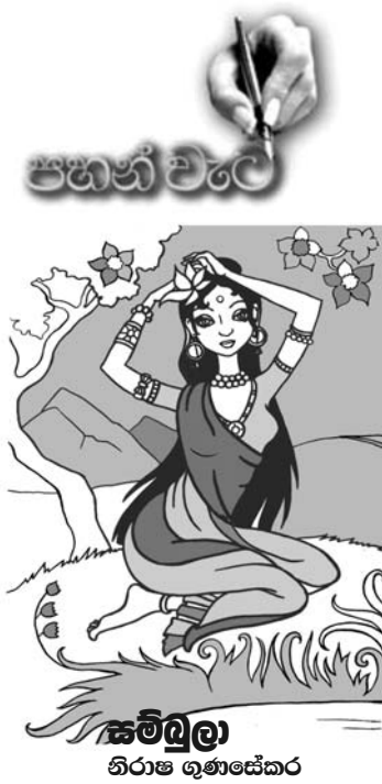
සම්බලා නිරාස ගුණසේකර