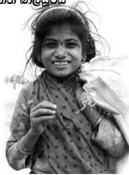
*ගෞතා කාරේරි දුර්වයේ දී ය*

මිනිස් පුවරුව නො සරණ අඳුර වටලූ තිරිඟු කාසක නිවී අළුවන රත්වන බුදුදකලාව ම මේ ලෙස දරාගන්නේ කොතොමද?