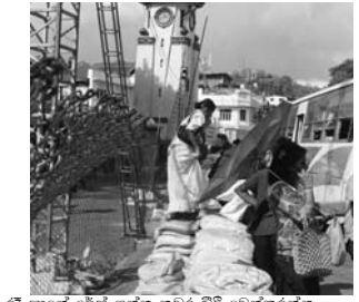
රූ පාමේ රේස් යන්න නුවර වීදි වෙන්කරන්න බේබලා හේ ගත් කඩන්න.එපා අපේ එරෙහිවෙන් රටක ඉදන් ආපු සුද්දේ මල් වට්ටිය ගන්න මන්න මාලිගාව ලගින් යැදි ගැටි රේස් බලන්න යන්න

මාලිගාවේ තේජස දැක දළදා ගිම් පිහිට ගන්න යුරෝපයෙන් සුදු ඇදුගෙන ආපු ඇයො මේ අනන්ත මල් පුදලා තෙල් පුදලා දළදා ගිම් වැදලා එන්න යමින් ගමන් බිර බිබි ගැටි රේස් බලන්න යන්න