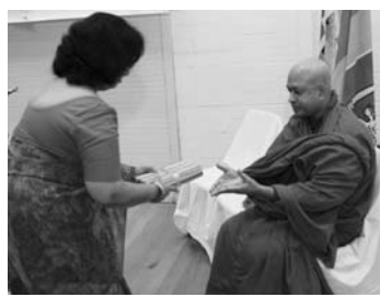
ගරු භාමවුන්ගේ විපිත ස්වාමීන්වහන්සේට පොත පිළිගන්වමින්

ස්වර්ණාකාන්ති අනාවප්‍රාප්ත සිදුරේ ධර්මවර්ධන කලාකර-වාවන් ආදරණීය බිරිඳයි.