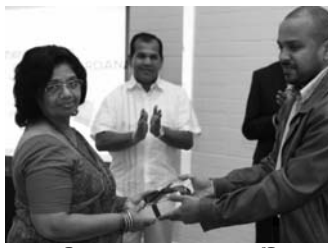
සරසවි ප්‍රකාශන ආයතනය පොත ලේඛිකාවට පිළිගන්වමින්