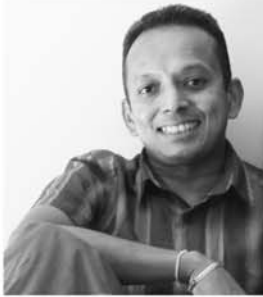
"නිශ්චිත ජයකොඩි" හා "කෑම් ලැස්තිය" පිළිබඳව කතියාව