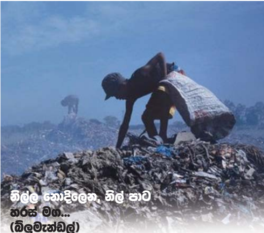
නිල්ල හොදිලෙන නිල් පාට හරස් මග... (බිලුමැත්ත)