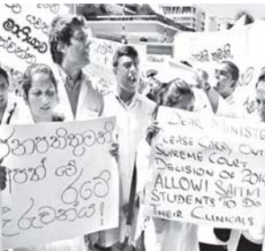
වාමාංශික පක්ෂ කරන්නේ ඇතුළුවත් හෝ නොඇතුළුවත් තමන්ගේම මිනිස්සුගෙ වල කපන එක.

සිගුරියි අඟහැරිගමනි. මෙන්න මබට ධබල් සැලියුටි.