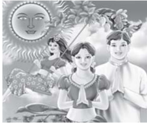
තිබුණා ගතිය තිබුණො නෑහැ.

ඉස්සර අවුරුද්දට මම කැමතිවුණේ අපි පිවිසිවුණා අපේ මහ ගෙදරට අපේ දොමඩියන්ගේ සියලුම නෑදෑයන් දවස් දෙක තුනකට හරි ඇවිත් අවුරුද්ද ගත කරලා යන පුරුද්දක් තිබුණා නිසා. අපේම කට්ටිය එක්ක එකට ගත කරන්න ලැබුණා ඒ කාලය මාරුම සොමි කාලයක්. ඊට පස්සේ ඒ සම්බන්ධතා විසිරලා ගිනිත් අපි හැමෝම අපේම පවුල් වශයෙන් වෙනමම අවුරුදු සැමරීමක් නොදයි තමයි. ඒත් අපි ඉස්සර