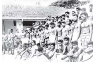
මරුණා උන්ට වඩා දුකක් මට දුන්නේනේ මොකද මන්දා..

බොහෝ දෙනෙක් අප්‍රේල් විරුවො ගත දන්නේ නෑහැ. දන්නේ 88 - 89 කට්ටිය ගැන විතරයි. හැම අප්‍රේල් මාසෙම අලවන "සදා සමරමු සොහොයුරෝ" පෝස්ටර් මීටියක් අරගෙන අලවන්න යන එවුන් ගැන