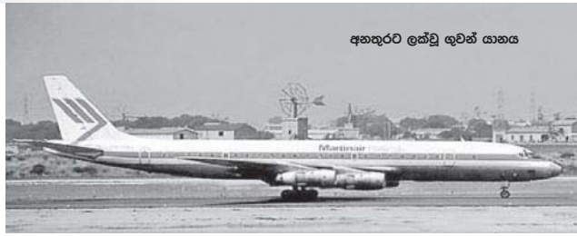
අනතුරට ලක්වූ ගුවන් යානය

ගාර පහසුකම් නොඅඩුව තිබිණ. වැඩමුළුවට පැවැත්වීම සඳහා සුදානම් කර තිබුණේ දෙසැම්බර් දෙවන දා සිට හත්වන දින දක්වාය. මුල් දින දෙකෙහි කාර්ය සැසි රාශියක් කර පැවරුම් ද කිහිපයක් අවසන් කිරීමට තිබුණු බැවින් එළඹ දිනයේ දිවා ආහාරයෙන් පසු තරමක විවේකයක් ලැබිණ. සියලුම පැවරුම් එදින රාත්‍රී ආහාරයට පෙර අවසන් කළහොත් රාත්‍රියේ අහසේ තරු රටා නිරීක්ෂණයටත්, පසුදින ලක්ෂ්‍යාණ විදුලි බලාහාරයේ අධ්‍යයන වාර්තාවක් සඳහා යා හැකි බවත් අපට දැනුම් දෙන ලදී.