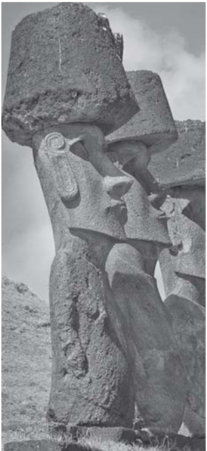
වනවා යයි සැලකේ. රතු පැහැති ,scoria, නම් ගිනිකඳු පාෂාණ වලින් මෙය සාදා ඇත.එක් පිලිමයක් හිම කිරීමට 5 - 6 ක් අතර කණ්ඩායමකට වසරක්වත් ගත වන්නට ඇතයි සැලකේ.

Moai පිලිම බහුතරයක පපු ප්‍රදේශය සහ උරුකය ඇති අතර , තවත් සමහරක අත් සහ ඇතිලිද ඇත. එක පිලිමයක පමණක් පාද ඇත. හිස ශරීරයට වඩා 3/5 පමණ විශාල වන ලෙස සාදා තිබීම විශේෂත්වයකි. බොහෝමයක් පිලිම එවා සාදන ලද ගල් ආකරය වූ , Rano Raraku, හි ඇත. ඒවා නියමිත ස්ථානයට ගෙනයාමේ අපේක්ෂාවෙන් එසේ