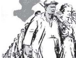
අත්පොළසන් දෙන හැටින් දැක්කා. යමක් දන්න කියන කාලේ ඉඳලම විජේලවය ගැන හින මව්පු මට මාර ජෝලි.

ලංකාවේ නිර්ධන පන්ති විජේලවය සිදුවෙන්න අත ලුහයි කියලයි මට දැනුණා මේ පාර කම්කරු මැයි දින පෙළපාලි වලට සහභාගිවුණා කම්කරු ජනතාවගේ ප්‍රමාණය දැකලා. අම්මපා මේ සෙනෙ කන්දරුවෙන් එක විජේලවය දෙවෙයි විජේලව දෙක තුනක්ම කරන් ඇහැකිනෙ.. කම්කරුවන්ගේ දිනේ වේදිකාවලින් ඇතුණා කතා වලින් කම්කරු පන්ති පීච ගුණය දෝරේ ගලා ගියා. ඒ කතා වලට පහළ ගියා කම්කරු ජනතාව