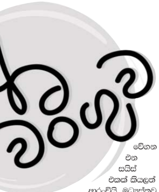
වෙගන එන සයිස් එකක් කියලත් ආරාමියයි. මධ්‍යස්තව බලන හැමෝම ඇතුළුව කියන්න උන්නන්සේලා කියන දේවල් නම් ඇත්ත ඒත් කරන දේවල් නම් උල් අවුල් කියලා. ඉතින් අපි කොහොමද අප්පා නිර්මල සත්‍යය සොයන්නෙ.

අත්තර්ජාලය යන කොමල බණ පිරිත් අහලා මට ඇති වෙලා ඉන්නෙ. ඒ කියාම මට හිතෙන්නෙ සත්‍යය සෙවිල්ල පැත්තකින් තියලා පරණ පුරුදු විදිලටම මැරි පහනක් බකට් එකක් හදාගෙන වෙසක් සමරන්න.