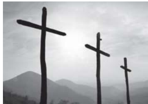
අදහන්නේ එයින් තමන්ට ලැබෙන සැකසීමත් අනෙකාට දැක්විය හැකි දසාවත් කරුණාවත් වෙනුවෙන් ආගමෙන් කෙරෙන මග පෙන්වීම නිසාත් නේ. කවුරු උනත් බේද්ධ කනෝලික ක්‍රිස්තියානි හින්දු ඉස්ලාම් කියලා වෙනසක් නැහැ. ආගම් තමන්ට රිසි දේ අදහන එක ඉතා හොඳයි. ඒක තමන්ගේ විතරක් කරගන්නේ නැතුව. ආගම් කියන්නෙ පොදු දේවල්. කොයි ආගමෙන් පදනම තමයි කරුණාව දසාව නා

වෙසක් නත්තල් ගැන හැම අවුරුද්දකම මොකක් හරි සටනනක් ලිව්වත් පාසිකු ගැන කවදාවත් කතා කරන්නවුණේ නැහැ. හැමදාම කලේ පාසිකු වෙනුවෙන් ලැබෙන නිවාඩු දවස් නතර කොනේ හරි ගත කරන්න යොදා ගන්න එක විතරයි. ඡේද තුමන් කුරුසියේ ඇණ ගැසීමේ සිට යලි උරධාන වීම දක්වා සිටුව සිද්ධි අනුසම්පාදනා කරමින් පැවැත්වෙන පාසිකු උපසම්පාදනා ලංකාවේ හම් ජයංග ගන්නවා. ලංකාවේ කරපු ඒ වාර්තා මෙහෙය ඇවිල්ලත් කරන එක වැදගත්. හැම මිනිසෙක්ම තමන්ගේ ආගම