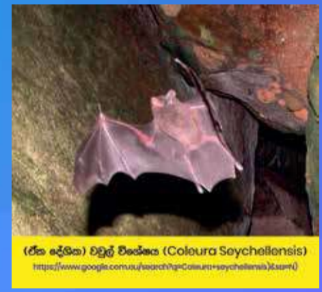
(ඒක දේශික) වඩුල් විශේෂය (Coleura Seychellensis) https://www.google.com.au/imgz?img=Coelura+seychellensis&safe=1

මීට අමතරව, මෙම දූපත් සමූහයේ තිබෙන, ඒක දේශික ශාක 75කින් 61 ක් පමණ සිල්වට් දිවයිනේ පමණක් තිබෙන බවද, එම දිවයින කුරුළු පාරාදීසයක් බවද නිරීක්ෂණය කර තිබේ. අගනා ජෛව විවිධත්වයක්ද සහිත, ජීව විද්‍යාත්මක