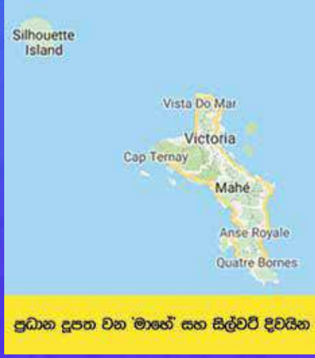
ප්‍රධාන දූපත වන 'මාහේ' සහ සිල්වට් දිවයින

රටවල් කිහිපයක ධනවත්තු තම වතු පිටි සහ වගාබිම් වල සේවය සඳහා ග්‍රාමිකයින් ලබා ගැනීම පිණිස ඒ වන විට අඳුරු මහාද්වීපයක්ව පැවති අප්‍රිකාව වෙත සිත්