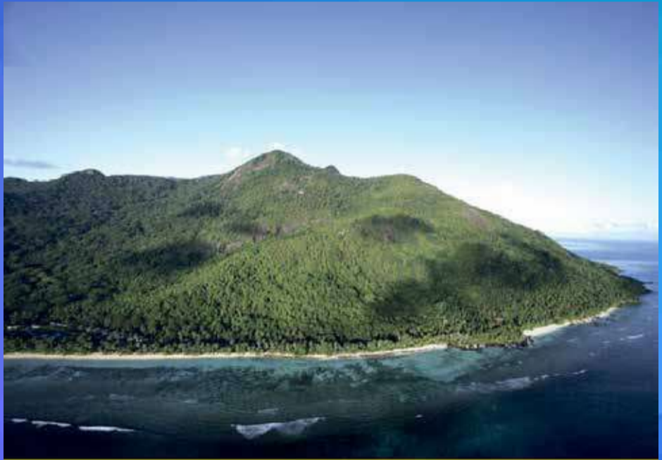
සිල්වට් දිවයින, මාහේ සිට පෙනෙන ආකාරය

අතිශයින් භාජනවී ඇති, වලිගයේ කොලො පුවක් මෙන් හැකිලිය හැකි පටලයක් වැනි, විකරණයක් සහිත ඉතාමත් විරල එරටට ආවේණික (ඒක දේශික) වඩුලෙකු සිටින බව අසන්නට ලැබිණ. (සංසරක්ෂිත මධ්‍යස්ථානයේ ෆෝමලින් ද්‍රාවණයක දැමූ දුර්ශකයක් පමණක් අපට දැකගැනීමට හැකි විය.) එම මධ්‍යස්ථානයෙන් ලබාගත් තොරතුරු වලට අනුව ලෝකයේ වෙනත් කිසිම ස්ථානයක නොමැති, මෙම වඩුලක් මෙහි සිටින නිසි දෙනෙකුගේ පමණ රංචුවකට සීමාවී තිබීම නිසා වඳ වී යාමේ තර්ජනයේ අන්තයටම පැමිණ ඇති බව පෙනේ. "සොබා දහම සුරැකීමේ අන්තර් ජාතික සංගමය (International Union for Conservation of Nature - I.U.C.N.) විසින් ඔවුන්ගේ රතු දත්ත නාමාවලිය මගින් හෙළ කර ඇති ආකාරයට මෙම වඩුලු විශේෂය වඳවී යාමේ තර්ජනයට අතිශයින් ගොදුරු වී තිබේ. එම තත්වය මඟ හැර ගනිමින් මොවුන් සංරක්ෂණය කිරීම සඳහා ජාත්‍යන්තර සංවිධාන මහත් පරිශ්‍රමයක් දරන බවද දැනගන්නට ලැබිණ.