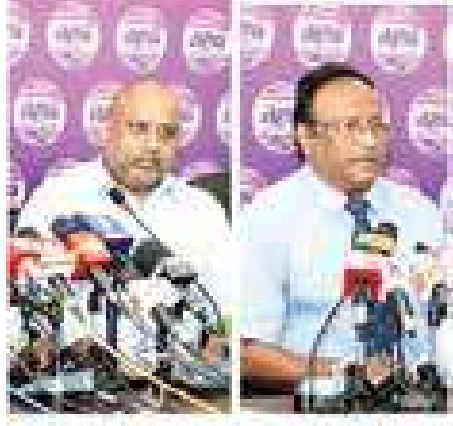
ලා අපරාධකරු හිටපු නාවික හමුදා පතිවරයා සම්මුතුව රිකා අමුණිගු කමා විශේෂාංගයක් සහ 40 පීනීවා මානව හිමිකම් කවුන්සිලයට වාර්තා කළ අයුරු

මේ අතර පසුගිය මුහුණපතින්දා බ්‍රිතාන්‍ය පාර්ලිමේන්තුවේදී බ්‍රිගේඩියර් ප්‍රියංක ප්‍රනාන්දුගේ සිද්ධිය පිළිබඳව කොටි ඩයස්පෝරාවට සම්බන්ධ මන්ත්‍රීවරයකුද ස්ථවත් මොර්ගන් විසින් එරට විදේශ කටයුතු කාර්යාලයේ ලේකම්ගෙන් ප්‍රශ්න කරනු ලැබීය.