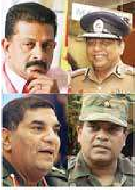
මෙරට සමඟ පීනීවා ඉදිරිපත් වූ අයුරු වි අධි හමුදා සහ පොලිසි නිලධාරීන් පීනීවා හිමිකම් කවුන්සිලයට වාර්තා කළ අයුරු සහ පොලිසි නිලධාරීන්

පතිවරයකුද වසන්ත කරන්නාගොඩ අත්අඩංගුවට ගන්නැයි නීතිපතිවරයා රහස් පොලිසියට උපදෙස් දීමක් ඊට එරෙහිව හිටපු නාවික හමුදාපතිවරයා මූලික අයිතීන් පෙන්නමක් ගොනු කිරීමේ සිද්ධිය කොටි ඩයස්පෝරාව තුළ පිළිගැනී දුන්නේය.