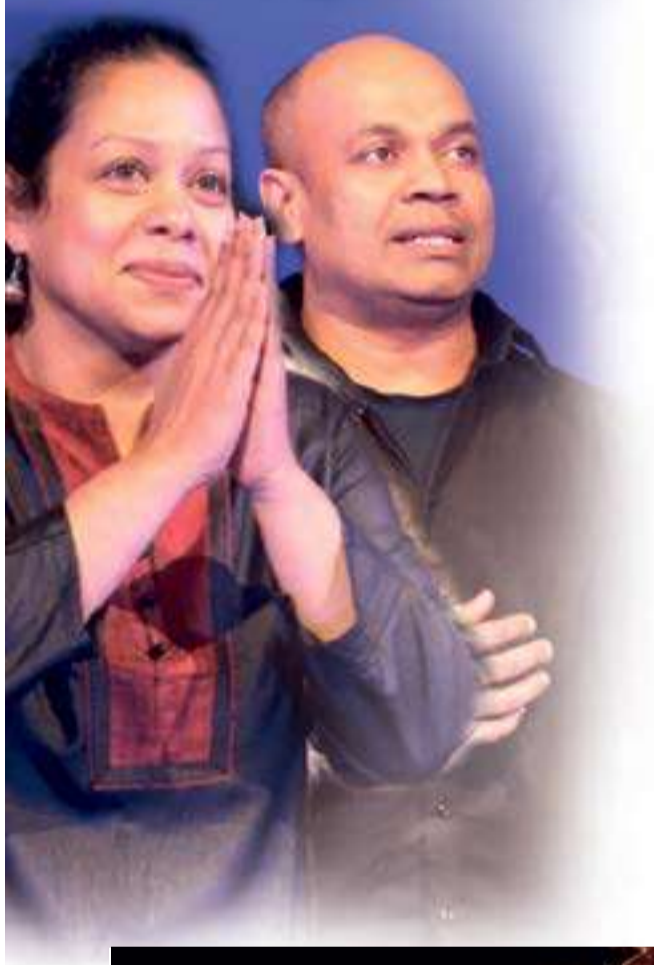
අභියෝගයකි. නාට්‍යය ළමා නාට්‍යයක් වූ විට ඒ අභියෝගයේ ප්‍රමාණය දෙගුණ තෙගුණ වෙයි.