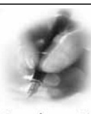
ශ්‍රී ලාංකීය දැන්වන විභාගී