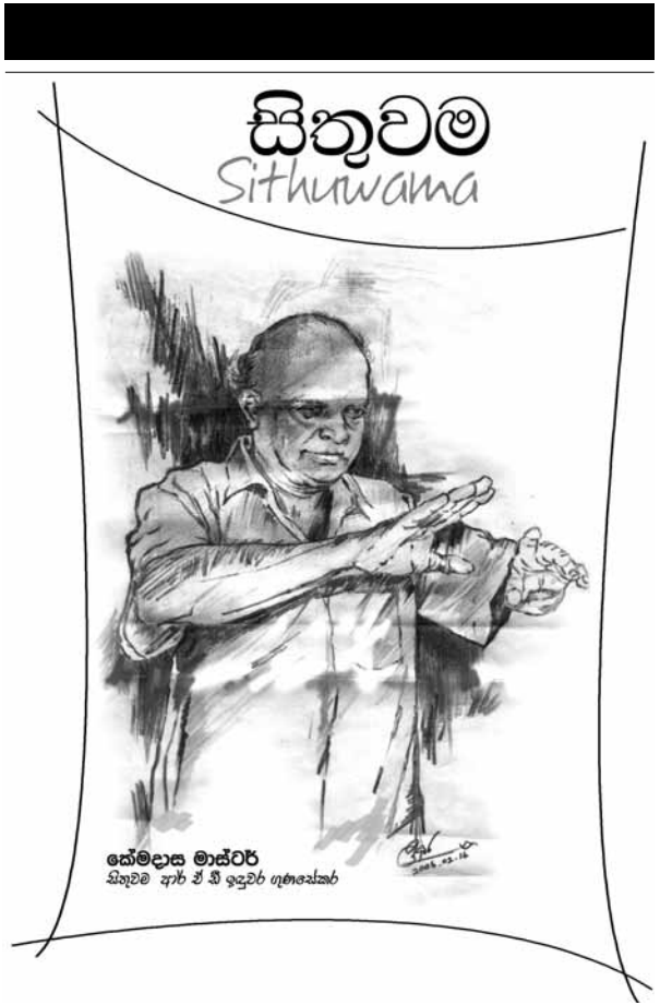
කේමළාස මාස්ටර් සිතුවම අග්‍ර ඒ ඒ ඉදුවර ගෞරවයකරු

-අවුරුද්ද ගැන නම් ඉතින් පිටුවක් හෙවෙයි, පත්තරේම පිරෙන්න වුණත් ලියන්න බැරය" පන් හති ඇරයා. ඒ අල්ල පනල්ලේ පින් තමන්ගේ වැඩේ අහවර කරලා. මන්විලි පදින