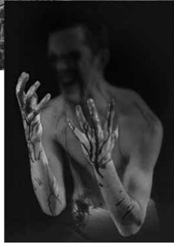
ඇනගෙන ඇස් දෙක අහ්ඩ කර ගනියි. ඉන් පසු ඔහු තිසිරියන් කඳු වැටියට පලා යයි. මෙතැනින් නාට්‍යය අවසන් වෙයි.

මෙම පුරාවෘතයේ කිසි පළකම ඩෙල්ට් දෙවොලේ තිබිනි කෙරෙහි ශ්‍රීකයන් තුළ ඇති විශ්වාසයක් ගැන සඳහන් වෙයි. මෙම ඩෙල්ට් දෙවොල යනු කුමක්ද යන්න දැන ගැනීම මෙම ලිපිය කියවන ඔබට වැදගත් වේ යයි සිතමි. ඩෙල්ට් යනු තිබ් නගරයට සැතපුම් සිය ගණනක් වයඹින් පිහිටි නගරයකි. එහි පිහිටි ඇපලේ ගේ දෙවොල එහි වාසය කරන පුජකයන්ගේ දක්ෂතාවය නිසා ඉතාම භාස්තමි තිබෙන නැතක් ලෙස මුල ග්‍රීසිය පුරාම ප්‍රසිද්ධියට පත්ව තිබිණි. ග්‍රීසියේ නන් දෙසින් පමණක් නොව පිට දේශ වලින්ත් ඇපලේ දෙවියනගෙන් තිබිනි අසා ගැනීමටත් උපදෙස් ලබා ගැනීමටත් ජනයා ඩෙල්ට් දේවාලයට ගියේ ය. ඩෙල්ට් පුජකයන්ට වැරදුණේ කලාතුරකිනි. ග්‍රීසියේ නොයෙක් දෙසින් ජනයා දිනපතාම වාගේ