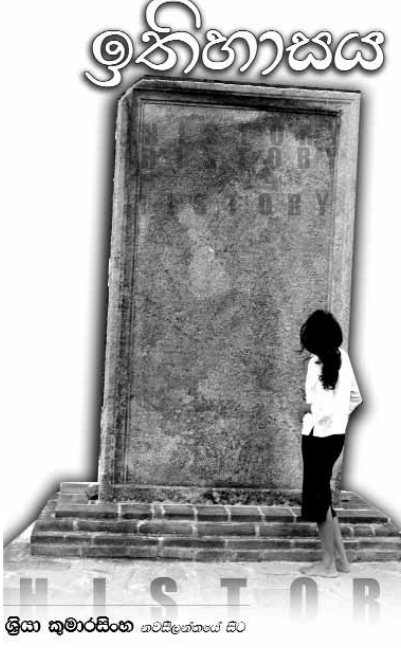
ශ්‍රියා කුමාරසිංහ ගමනේදීගත් සිට

අනුරාධපුරය පිහිටා ඇත්තේ නුවර සිට සැතපුම් 90ක් පමණ උතුරු දෙසිනි. එහි කාමර ඇති අපහසුතාවය නිසාම අනුරාධපුරය නැරඹීමට යන