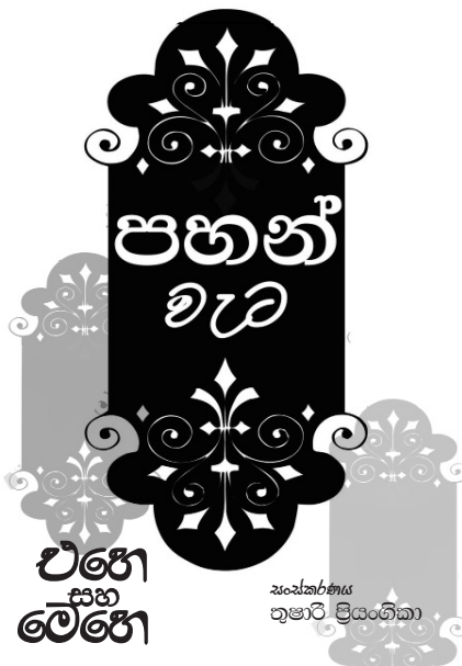
සංස්කරණය කුමාරි ප්‍රියංතිකා