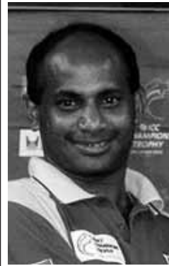
ශ්‍රී ලංකා ක්‍රිකට් කණ්ඩායම මෙවර ලෝක කුසලාන තරගවලින් සහභාගි වන්නේ අවිනිශ්චිත ප්‍රතිඵල සමගින් ය. මේ තරගවලින්දීත් සියලු බලාපොරොත්තු සුපිරි