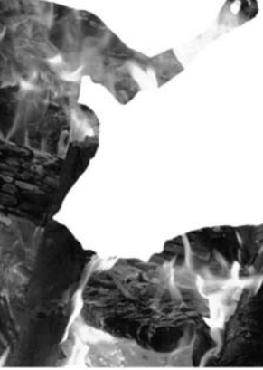
මානව දයාවන් යුත් සාමූහික ජීවිතයකට යොමු කරන යටාවාදී දහමක් ලෙස හඳුන්වන්න පුළුවන්.

ගත්තොත් බුදුන්ගේ වැඩම මිලඟ උපන ගැන හෝ හුදු සැසරයක් ගැන හෝ නෙවෙයි. මේ ප්‍රාණ කාලය තුළම විවිධ උපාදානයන් අනුව විවිධ භාවිතයන් තුළ දැරීමටම නිමවෙමින් යන උමතු පැරනෝතික ගින්න නිවා සමගන් වෙමින් අතිදොණයෙන් සරු විවිධයක් හෙවෙයි. මේ අනුව බුදු දහම පර ලොවත් ජය ගැනීමට යෝජනා කර කලය කා දමන වැඩිපිලිවෙලකට වඩා මිනිසා කොබා දහම ගොදුරු කර ගැනීමේ විසරු දුක්කායකෙන් මුදවා