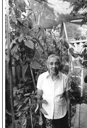
මා රජය (මහ රජයේ පොල් මානම) මහනම්පල ගස නැත් වල 'ලොකු' යන තේරුම ඇත.

ඇත්තේර, ඇත්දෙමට යන තැන්වල ඇත්තේර එම තේරුමයි. මිනිදු ලොවම 'මිනිතලාව' යනුවෙන් නම් පැයක් වේ. එසේම තමාගෙන් නම්පල - නම්පල වේ. පොල් (කුඩු) පලා, ගිවිපලා, තනපලා යන පද පොල් (කුඩු) පල, ගිවිපල, තනපල යනුවෙන් වෙනස් වී වරකට පැමිණ නැත. තමාගේ ගැටුණේ නම් කටුනම්පල, කුරුමාලු නම්පල, එළනම්පලත් අපේ දැක්මට ඇත. කුරු කොස් කුරුපොල්, කුරුබිල්ලා යන තේරුම් 'කුරු' යන කුඩා යන තේරුම බවද කුරුනම්පල යන්න පසුව කුරුනම්පල වී ඇතැයි සිතමි. බවු වරිලා, බවුමියා, බවු අලියා (බවු + බවුලො) යන තේරුම් බවු යන්නේ ඇත්තේ ද 'කුඩා' යන තේරුමයි. ලොකු යන තේරුම දීම සඳහා අපේ බාධාවේ අදි (අලිගමම) ඇත් (ඇත්තේර) මහ(මා) (මහනම්පල) පොල් (පොල් අඹ), තව (තව පිඹුරා), යෝද (යෝද රැලියා) රැකි පද බොහෝ තැන් මඬ දුනි. මේ 'ගෞරව' එසේ 'දැක්වෙන නම්පල ගස ඇත්තේ බවටත් මිසැල්ලියාවේ කල්ලිවෙඩිල්ලා නියමය. එය මීටර් 3.6ක් උසය. එහි අට්ටා ඇති වියන සෙවන තැබීම සඳහා ඉදි කොට ඇති මුහුණු මීටර් 3.3ක් උසය. නම්පල ගස යට සිටින වියනය මොන නියමයේ උස සිටිය ගත හැකිය. වින්දරය අවසානයේ නම්පල ඇට නැත්තක් කළ යුතුය. පැල උතුලා යළි සිටිනු ඇත්තේ කළ යුතුය. එවිට රැකීම බාල වේ. මහින්ද ඇත් නම්පල ගසක් වටා ගැනීමට කැමති වෙතිය සිතමි.