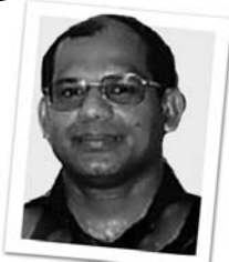
ආචාර්ය පාලිත ගනේවත්ත

සිංහල සාහිත්‍ය පොත පත පෙරළීමේදී පෙනෙන මෙවන් තොරතුරුවලින් හෙළිදරව් වන්නේ අපේ සිංහල කලා කාන්තාව උඩ කය නොවසා සිටි බවය. මෙකල නම් ලෝකයේ කවර රටක වුවද පියයුරු නිරාවරණය වන සේ උඩුකය නොවසා සිටින කාන්තාවන් අභිමුඛ සමාජයක ජීවත්වන්නන් ලෙස ඇතැම් අයකු විසින් සලකනු ලැබේ. සමාජයේ දියුණුවත් පරිණාමයත් සමග ඡිමිඨ හා අභිමුඛ යන සංකල්පය ද වෙනස් වෙයි. එය වනාහි ඕනෑම සමාජයක භාෂාව, සිරිත් විරිත්, ඇඳහිලි සිතුවම් පැතුම්, අදහස් උදහස් වෙනස් වන්නාක් මෙන් වෙනස් වන ස්වාභාවික සංසිද්ධියකි. කලාකරුවා මේ වෙනස දකින්නේ කලාත්මක ස්වරූපයෙනි.