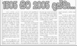
සන්නස 2009 මාර්තු මාසයේ දී සිය හතරවන වසර සම්පූර්ණ කළා ය.

වසර හතරක් පුරා අප ආ ගමන සුව පහසු ගමනක් නොවේ. මේ කාලය තුළ බොහෝ පුවත්පත් බිහිවනු ද වැඩි යනු ද අපි බලා සිටියෙමු. පුවත්පතක් යනු බොහෝ අය සිතනා ආකාරයේ සුවදායී කාර්යයක් නොවේ. ඒ වෙනුවෙන් අති මහත් කැප කිරීමක් කළ යුතු ය. ගත පහක හෝ ප්‍රතිලාභයක් නොලබා එවන් කැප කිරීමක් කරන්නට නම් ඒ වෙනුවෙන් උසස් ඇත් පිරිසක් එක් විය යුතු ය. සංස්කාරක වරයාගේ සිට පුවත්පතේ බෙදාහරින්නා දක්වා කිසිවකු ගතයක හෝ ගෙවීමක් නොලබන ඔස්ට්‍රේලියාවේ ඇති එකම පුවත්පත සන්නසයි. සන්නස මේ සා දුරක් ආවේ එවන් පිරිසක් සන්නසට එක්ව සිටින නිසා ය. නම් වශයෙන් සඳහන් නොකරම ඒ සියලු දෙනාටම ස්තූති කරන්නට මම මේ අවස්ථාව කර ගනිමි.