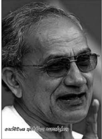
පෝලන්ත ජනතා විමුක්ති පෙරමුණේ නායකයා

ඒ වගේම ජනතාව බරපතල ලෙස පීඩාවට පත් කරමින් පාලකයින් අත්තනෝමතික ලෙස නාස්තිකාර ලෙස කටයුතු කරනවා නම් තම අයිතීන් වෙනුවෙන් අරගල කිරීමට එක් ජන කොටසටම අයිතිය තිබෙනවා. එය යුද්ධයට බාධාවක් නොවෙයි. බඩු මිල අඩු කරන ලෙස ඉල්ලා කරන අරගල, සහන ඉල්ලා කරන ගොවි අරගල, වැටුප් ඉල්ලා කරන සේවක අරගලයාධර්මය වන්නේ ඒ අනුවයි. එම අරගල හරහා සම්මත කරන තුරු අයිතීන් ඉල්ලන්න එපා කියමින් ආණ්ඩුව මහජන මුදල් නාස්ති කරන විට එයට වඩාගැනීමට කිසිදු දේශප්‍රේමියෙකුට බැහැ.