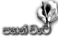
සංස්කෘතය තුණාරි මුරුගුණා

මුලින් මබ දුටුව දින බැඳුන පෙම හ දේ කෙමෙන් එය දැඩිව ඇලි කළ ගලක් ලෙ දේ මෙදැන් මබගේ බස මොන පුදුමය ද ව දේ නිවන් දැකින කුරු මා හර වෙන කවුද හො දේ