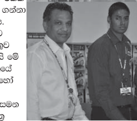
විවිධ ක්ෂේත්‍ර වල නියුතුව සිටිනා අපේම ඇත්තෝ මේ ඕස්ට්‍රේලියානු සමාජයේ ඉදිරියටම ඔවුන් සිටිති. ඔවුන් අපේ මව් බිමට

අපි කියමු කවුරු හරි වෙනත් ආයතනයකින් අඩු මිලට මේ භාණ්ඩ ලබා ගන්නට හැකි බව අපට දන්නවා නිසා. අපි සුදුසුම ඒ ගාණට වඩා අඩු මිලට ඒ භාණ්ඩය ලබා දෙන්න. එසේ කරන්නේ අපට යම් කිසි ලාබයකි තියෙනවා අප එයින් පාරිභෝගිකයාට පහසුවක් සැලසන්නයි. ඒ එක්කම අපේ අලුත් සේවාවක් තියෙනවා පැන්ට්‍රි කබඩ් සහ මුලතැන් ගෙඩි ලී බඩු සපයන. මේවා අපෙන් ගන්නවා නම් අපත් සමඟ එකතු වෙලා ඉන්නවා ඕස්ට්‍රේලියාවේ ප්‍රසිද්ධ ව්‍යාපාරික ආයතනයක්. ඔවුන් ඩොලර් 1000 ක භාණ්ඩ විවුච්චියක් ලබා දෙනවා.