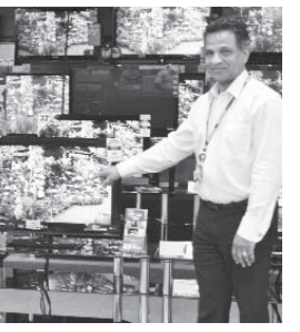
ගණනක් ශ්‍රී ලාංකිකයන් මගේ වැඩ වලට සහභාගි කරවාගන්න.

ඒ එක්කම මෙහි සේවකයන් 55 ක් පමණ සේවය කරනවා. එයින් ශ්‍රී ලාංකිකයන් 10 දෙනෙකු පමණ මම සේවයට යොදවාගෙන ඉන්නවා. එය අපේ අයට තවත් පහසුවක් වෙයි. අනාගතයේ මම බලාපොරොත්තු වෙනවා තවත් වැඩි