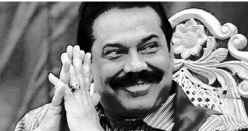
Point සහ "ආණ්ඩුවට" ස රෝගය" යන ලිපි දෙක පිළිබඳව ආවර්ජනයකි.

මේ ලිපි දෙකෙහිම පෙන්වන්නට උත්සාහ කරන්නේ ශ්‍රී ලංකාව ඉතා බිහිසුණු Killing Fields තත්වයකට කොමු වි ඇති බවය. මේ ලිපි ලියන මහත්වරුන් අමතක කර ඇත්තේ, අපේ මවු බිම " Killing Fields " ආකාරයට කොමු වුයේ 1980 දශකයේ පටන් බවය.