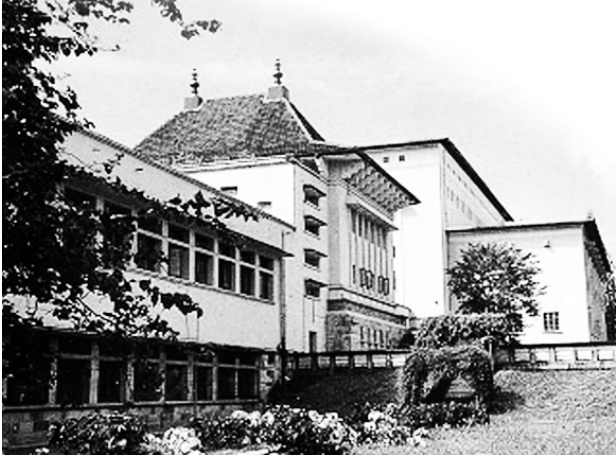
උටුවේ කළු මුලින් අතරිණි.

උදේ හවා එකී "ඒ" අකුර සහිත ප්‍රවර්ග ඉදිරිපිට සිට මා පාඩම් කටයුතු කරනු දැක, උසස් පෙළ විභාගයෙන් සත්‍යවශයෙන්ම මා "ඒ" සාමාර්ථ ගෙවත් විශිෂ්ට සාමාර්ථ හතරක් ම ගනු ඇතැයි ඇය ස්වයංමාභාවකට අසුවී සිටි නිසා ය. මා ලැබූ ප්‍රවීණතා ගැන මට ද දැනක් නොදැනුවත් නොවේ. අම්මා ගේ කළු මුලින් දැක කාමරයට ගිය මා මගේ පෙර කී "ඒ" අකුර සහිත ප්‍රවර්ග