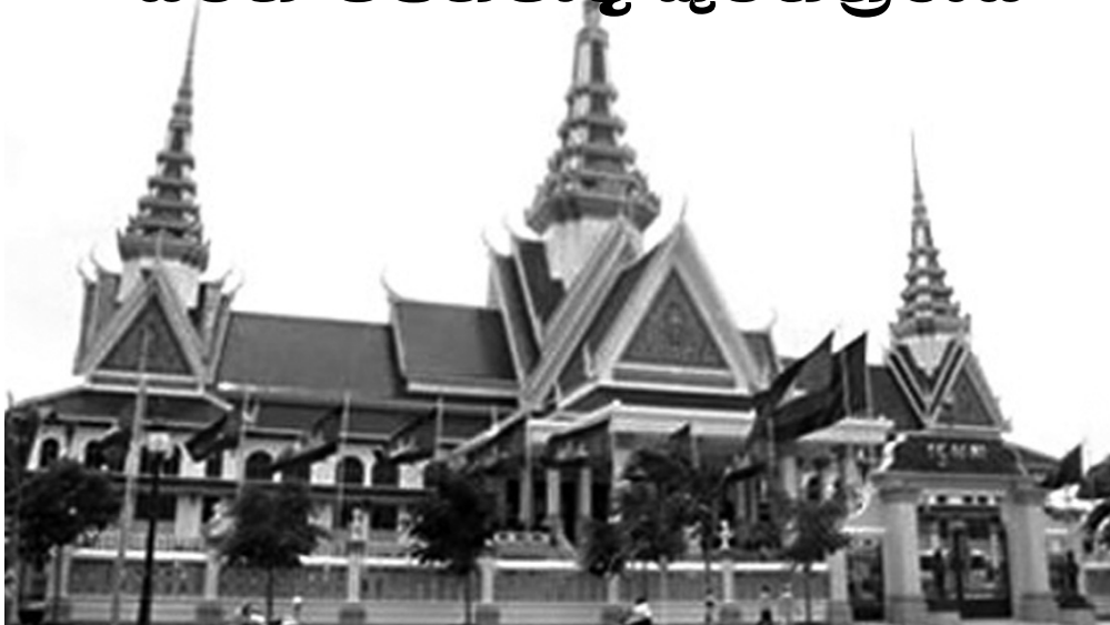
ම ආගමික ආරක්ෂකයා ද වේ" යන්න එම වගන්තියයි.

දැනට වන සහ විසිවන ශතවර්ෂවල මහා පරිමාණයෙන් සිදු වූ යුරෝපීය ආක්‍රමණවලින් ගැලවී ගියේ කිරිඳ රැකගැනීමට සමත් වූ අප කලාපයේ එකම රට වූයේ සියම පහලත් තායිලන්තය ය. කීර්ති ශ්‍රී රාජසිංහ යුගයේ දී ඕලන්ද නොකාවකින් ශ්‍රී ලංකාවට උපයමුද්‍රාව රැගෙන එන ලද්දේ එවකට තායිලන්තයේ අනුචාර වූ අයෝධ්‍ය නගරයෙන් ය.